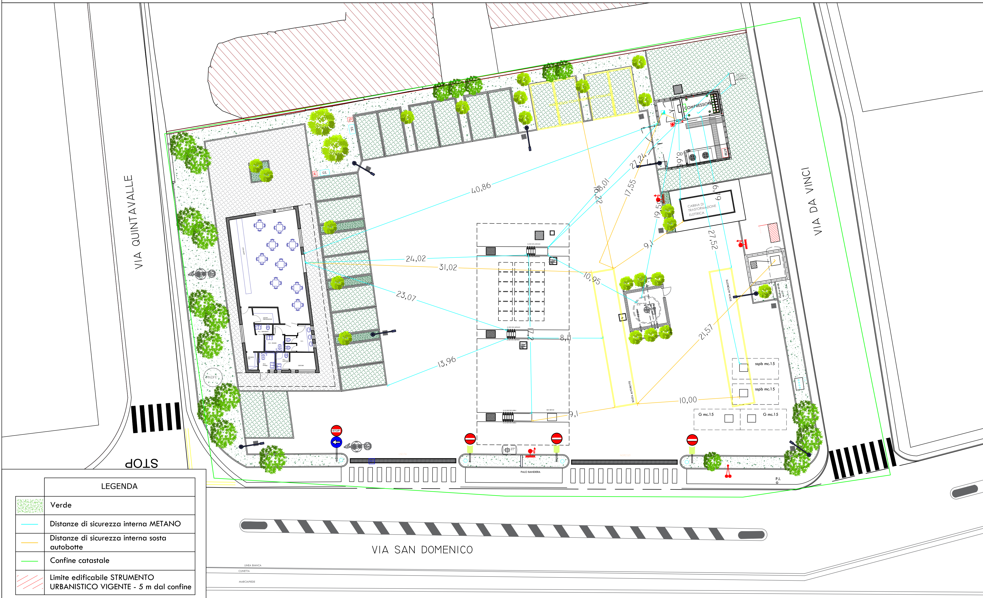
STATO DI PROGETTO _ PLANIMETRIA CON DISTANZE DI SICUREZZA INTERNA METANO - SOSTA AUTOBOTTE _ SCALA 1:200